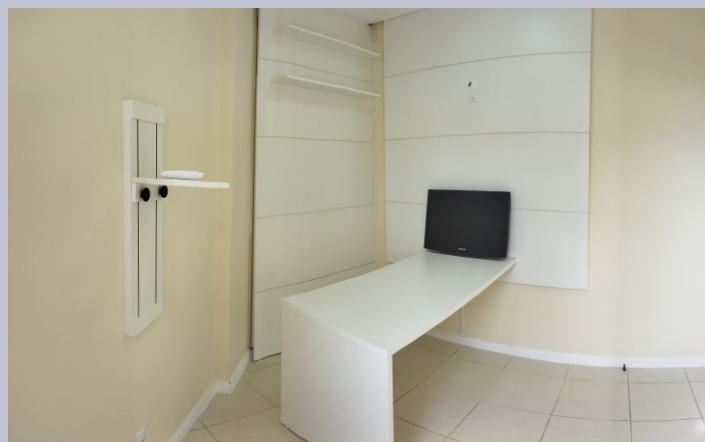
Novo estúdio de transmissões de lives do SINPRF/SC.

O novo estúdio está em fase de montagem dos móveis. Em breve, receberá o isolamento acústico e os equipamentos.